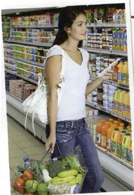
14 • inTavola

• acquistarlo surgelato , con qualche accortezza. Sogliola e peschatrice hanno una buona resa, una volta scongelate, mentre i pesci con la polpa particolarmente morbida sono meno buoni, se surgelati. Vanno benissimo i gamberi surgelati, da scegliere ancora con il guscio e crudi, non precotti.