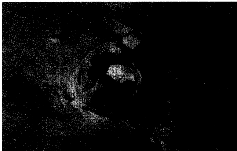
Eugenio Gilberti, Working Class Area, particolare, 2008

Da parte mia, chiamo plasma questo spazio – ma non si tratta di uno spazio – nel quale riposano – ma non esiste riposo – le diverse circolazioni delle totalizzazioni e delle partecipazioni in attesa di esplicitazione e di composizione. L'espressione può sembrare astratta, ma questo accade perché tutte le metafore più diffuse sono definite dallo zoom che obbliga a credere che si sappia di che cosa stiamo parlando quando