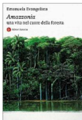
Emanuela Evangelista, Amazzonia. Una vita nel cuore della foresta , Laterza, 208 pagine, 18 €

L'anima del Giappone attraverso le sue isole. New York: Central Park, un'oasi di libertà individuale e uno spazio di democrazia. La Norvegia del premio Nobel Jon Fosse