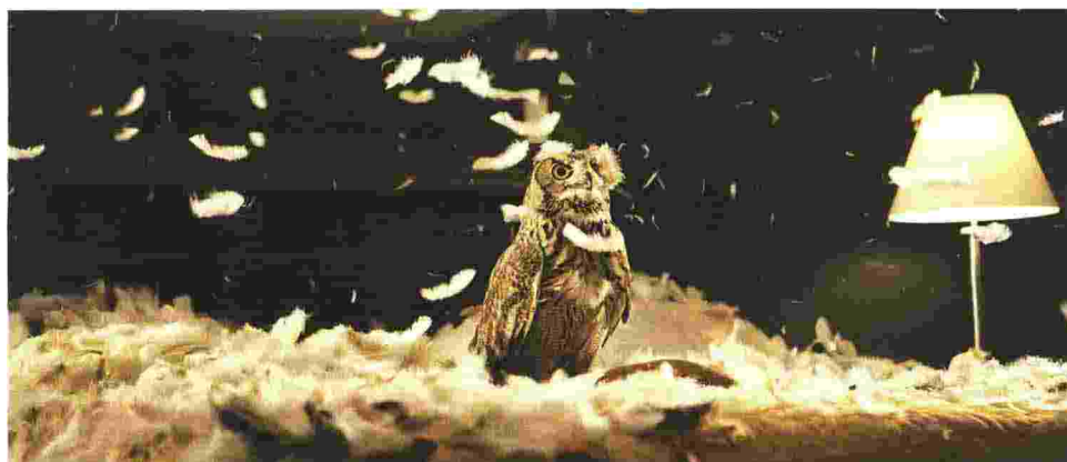
Doug Aitken, «Migration (empire)»

«A», astice/acqua: storia dei crostacei in attesa di giudizio ai ristoranti. «B», balena/baleniera: la moratoria del 1986 vieta la caccia alle balene a scopo commerciale, ma fino al 2013 ne sono state cacciate ben 49.029. E poi c'è l'elefante circense, l'oca «foie gras», il topo/tester per esperimenti, la nutria fuori tutela, la zebra da zoo. L'«Abbecedario degli animali», magnificamente illustrato da sette artisti diversi, a cura di Alessandro Fiori (per Safarà edizioni) è uno strumento di consapevolezza che, attraverso una sorta di bestiario in forma di alfabeto, racconta una serie di soprusi ai danni delle altre specie.