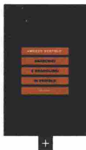
ANARCHICI E ORGOGLIOSI DI ESSERLO DI AMEDEO BERTOLO (ELÈUTHERA, PP. 328, EURO 15) È DISPONIBILE ANCHE IN PDF SOTTO LICENZA CREATIVE COMMONS SUL SITO DELLA CASA EDITRICE ( WWW.ELEUTHERA.IT )

A un anno dalla morte, pubblicati gli scritti dell'editore e attivista. Che con i libri di Elèuthera ha dato nuove voci al pensiero libertario