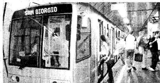
GENOVA, LA PIÙ PICCOLA È lunga 4,5 km. Attualmente 5 stazioni (Brin, Di Negro, Principe, Darsena, San Giorgio)