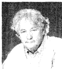
STUDIOSO Marc Augè

«La metropolitana è vissuta sempre individualmente, solo i percorsi singoli le danno una realtà, ma ciononostante è una realtà eminentemente sociale, la stessa per tutti, in grado di dare a ciascuno quel minimo di identità collettiva attraverso cui si definisce una comunità. In metro ci si guarda, di sfuggita, distrattamente, o magari ci si innamora. Bisognerebbe parlare di «solitudine» metropolitana, ma dovremmo subito, paradossalmente, declinarla al plurale, tante «solitudini». Alcuni metrò, poi, sono più romanzeschi di altri. Nel pomeriggio verso le tre o le quattro, quando tutti sono in ufficio, sono possibili incontri meno anonimi che nell'ora di punta. Capita allora di chiedersi chi sia o dove vada la sconosciuta o lo sconosciuto che ha attirato la nostra attenzione per un istante...».