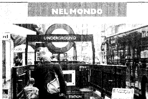
LONDRA, LA PIÙ ANTICA Gli inglesi la chiamano «Tube». Il primo treno sotterraneo entrò in funzione nel 1863