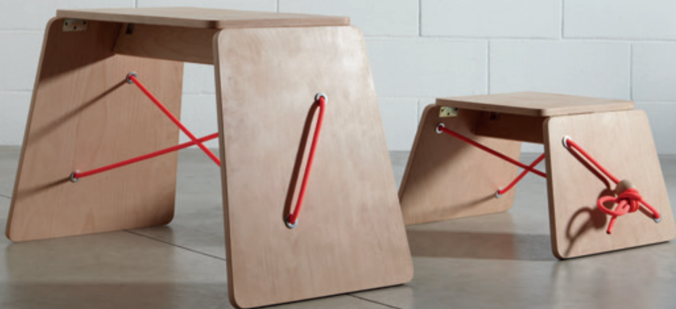
Paco y Paco di Claudio Larcher - Modoloco, simbolo della campagna Hispaniola - Design per solidarietà

ETICA ED ESTETICA, SOSTENIBILITÀ E BELLEZZA. IL DOPPIO VOLTO DEI PROGETTISTI CHE MIGLIORANO IL MONDO