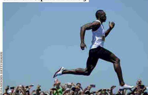
Usain Bolt a Copacabana nel 2013